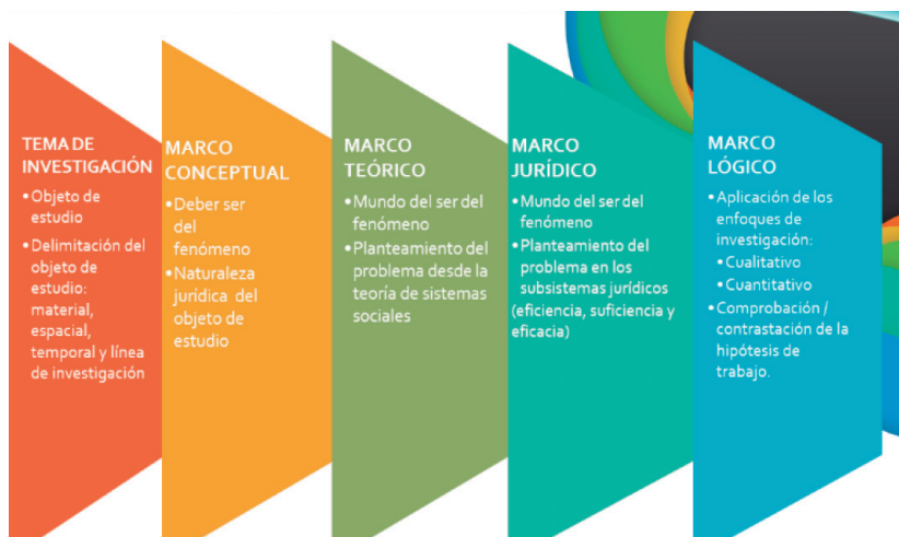
Diagrama 3 Resumen